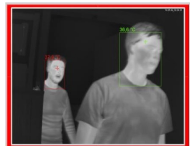
Alarm bei erhöhter Körpertemperatur

Der BT-Inspector ist ein Plug & Play System zur berührungslosen Körpertemperaturmessung. Es basiert auf einer bewährten industriellen IR-Kamera, kombiniert mit einer intelligenten Software zur Personenkontrolle, die intuitive Benutzeroberfläche erfordert keinerlei Vor- / Detailkenntnisse.